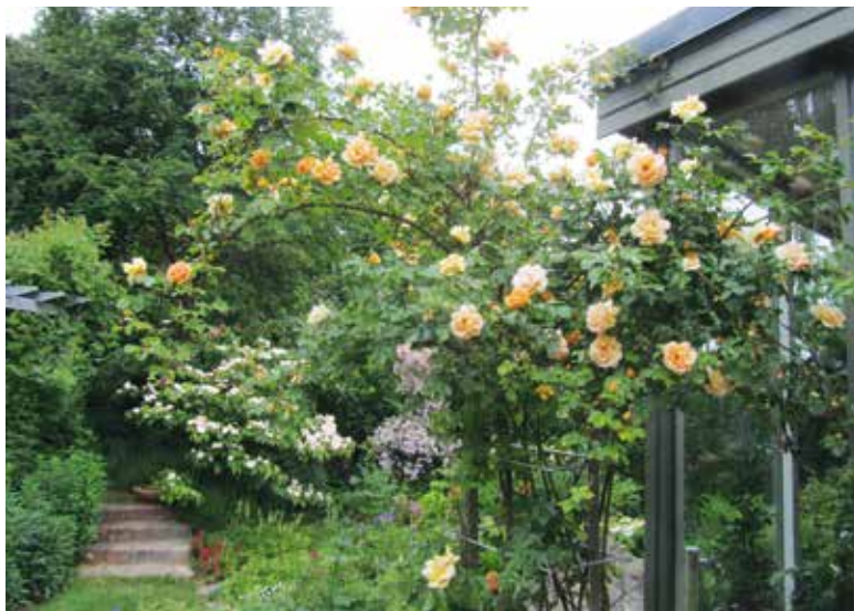
Rosen Maigold över 25 år gammal.

Trädgårdsentré med takplantering, rhododendronrabatt samt höga träd och växthus. I trädgården finns mindre rum, flera sittplatser, porl från rinnande vatten och många perenner, träd och buskar. Här finns även plats för meditation och vila, bland annat i hängmattan! Välkomna!